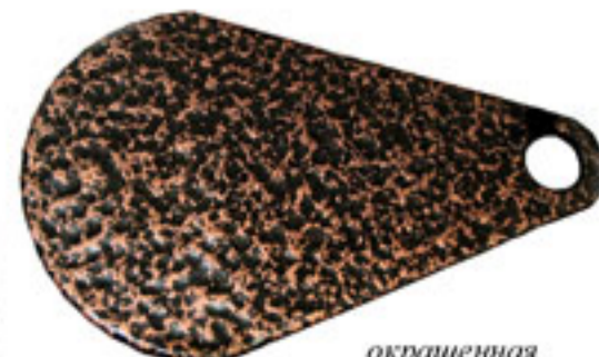
окрашенная конструкционная сталь