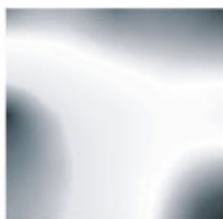
полированная нержавеющая сталь