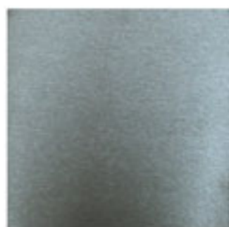
шлифованная нержавеющая сталь