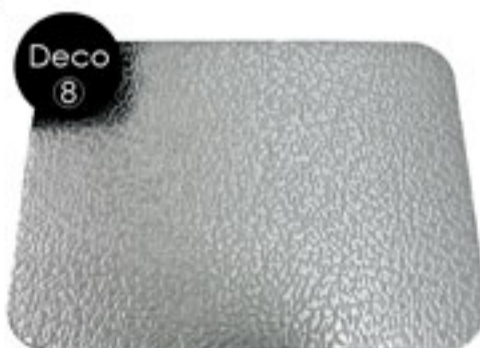
декоративная нержавеющая сталь