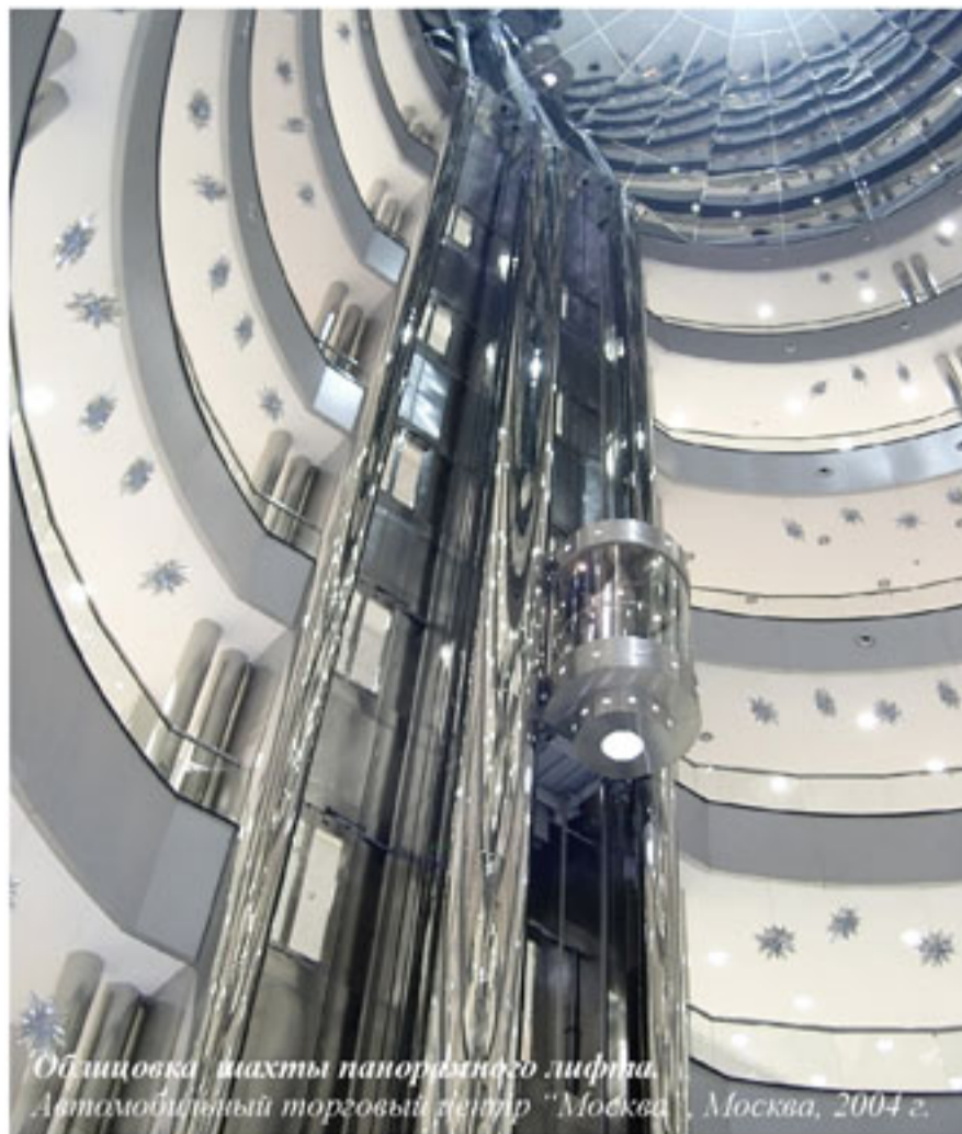
Облицовка шахты панорамного лифта. Автомобильный торговый центр "Москва", Москва, 2004 г.