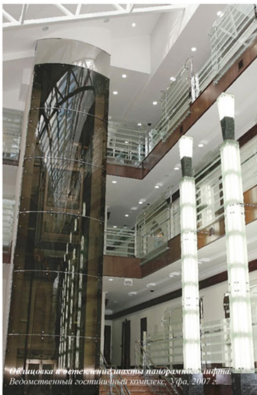
Облицовка и остекление шахты панорамного лифта. Ведомственный гостиничный комплекс, Уфа, 2007 г.