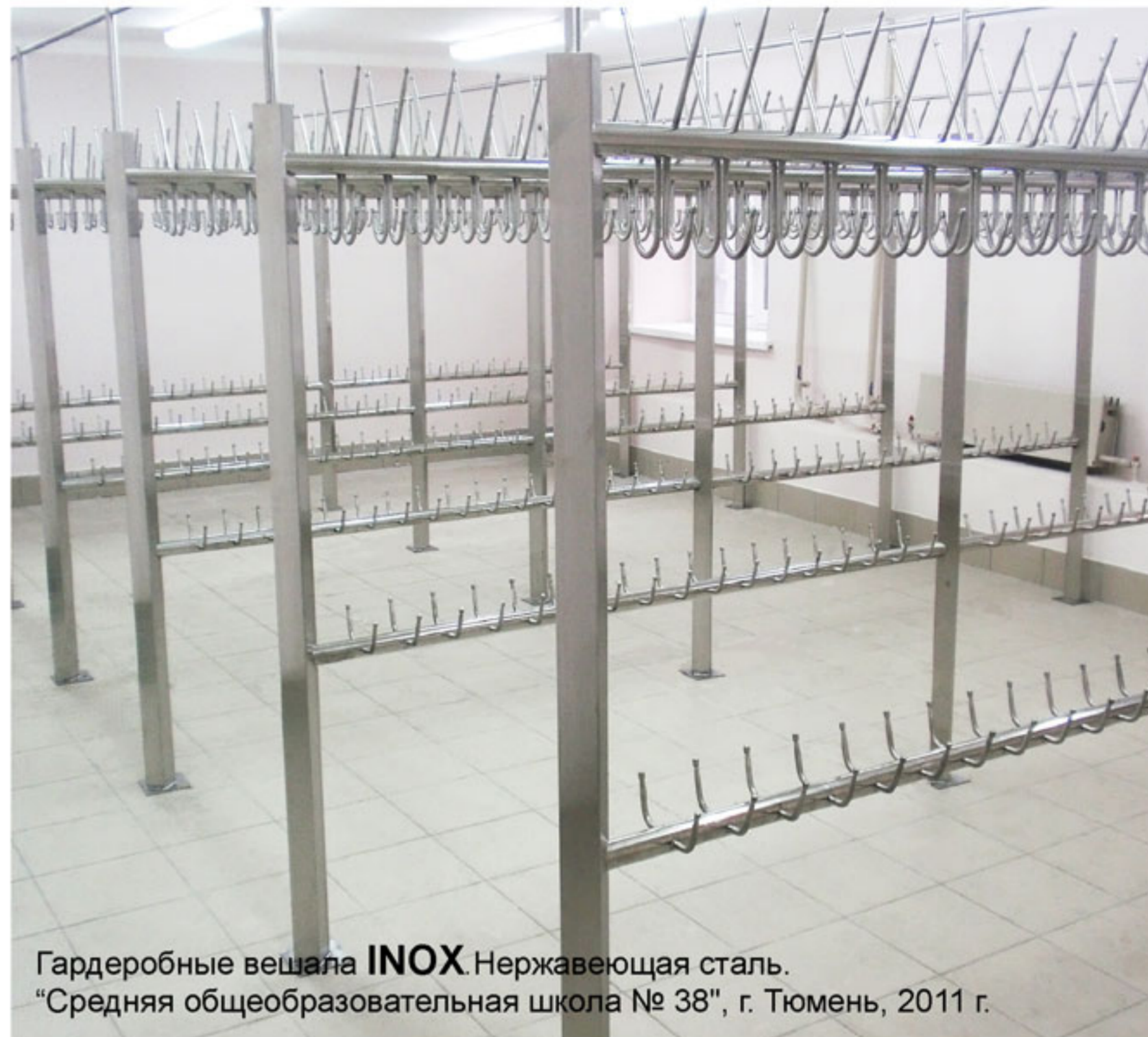
Гардеробные вешала INOX . Нержавеющая сталь. "Средняя общеобразовательная школа № 38", г. Тюмень, 2011 г.

"Средняя общеобразовательная школа № 31", г. Ишим, 2010 г.