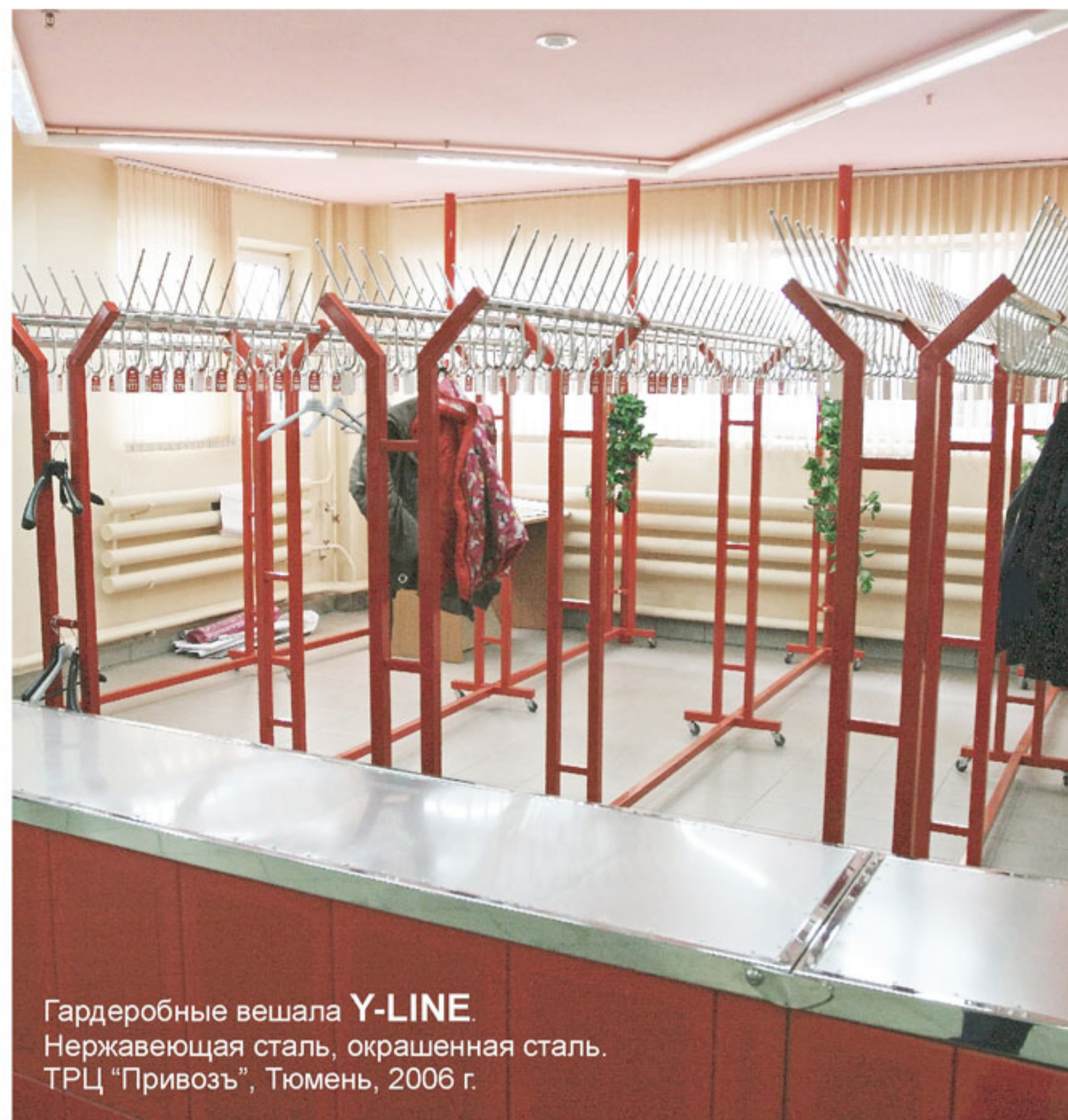
Гардеробные вешала Y-LINE . Нержавеющая сталь, окрашенная сталь. ТРЦ "Привоз", Тюмень, 2006 г.

Материал: полированная и шлифованная нержавеющая сталь, нержавеющая сталь с покрытием нитрида титана "под золото", окрашенная сталь, латунь.