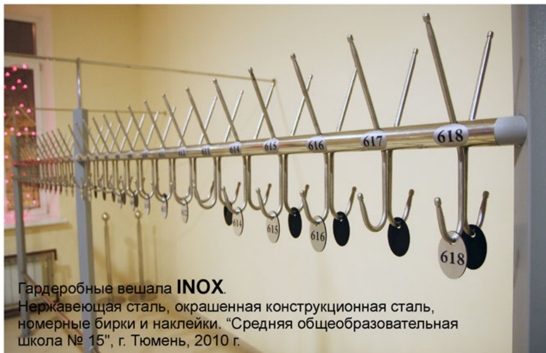
Гардеробные вешала INOX .

Нержавеющая сталь, окрашенная конструкционная сталь, номерные бирки и наклейки. "Средняя общеобразовательная школа № 15", г. Тюмень, 2010 г.