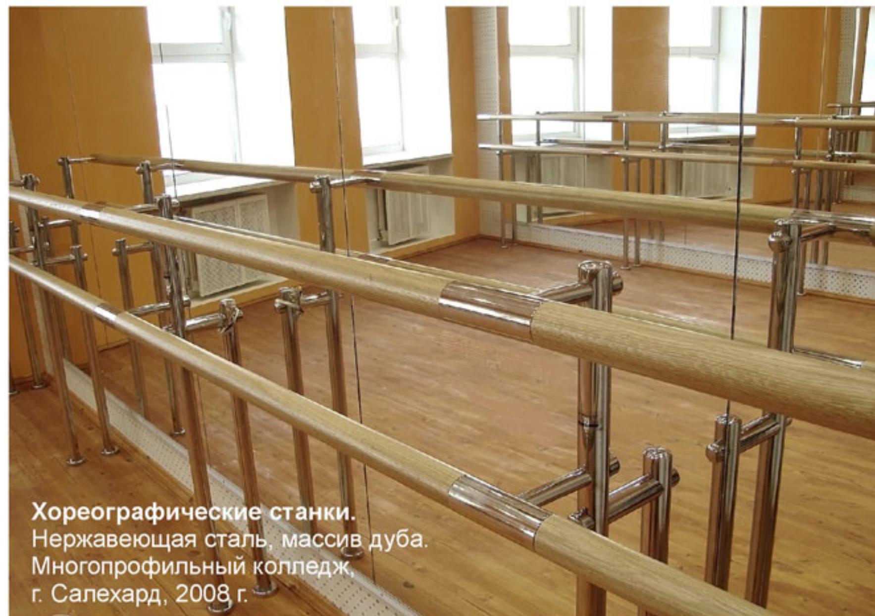
Хореографические станки. Нержавеющая сталь, массив дуба. Многопрофильный колледж, г. Салехард, 2008 г.

Нержавеющая сталь, окрашенная конструкционная сталь, номерные бирки и наклейки. "Средняя общеобразовательная школа № 15", г. Тюмень, 2010 г.