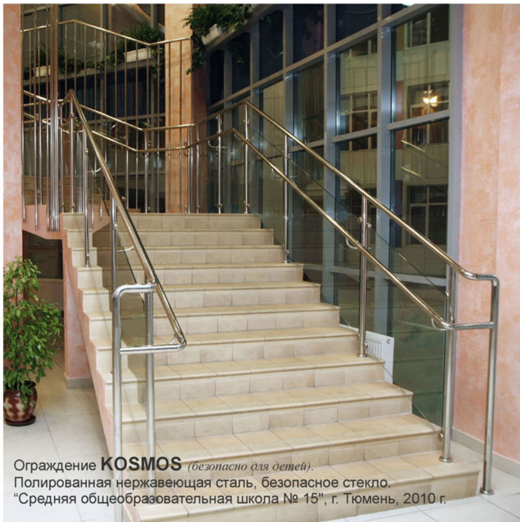
Ограждение KOSMOS (безопасно для детей). Полированная нержавеющая сталь, безопасное стекло. "Средняя общеобразовательная школа № 15", г. Тюмень, 2010 г.

ООО "ТМ-Ресурс" 625000, Тюмень ул. Дзержинского 62/2 тел. +(3452) 29-52-20 тел. +(3452) 29-52-21 info@tm-r.ru www.tm-r.ru