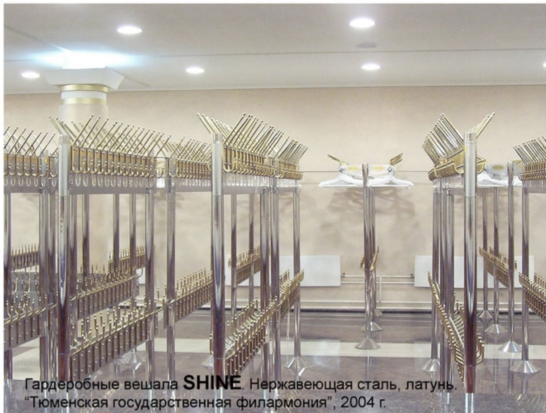
Гардеробные вешала SHINE . Нержавеющая сталь, латунь. "Тюменская государственная филармония", 2004 г.